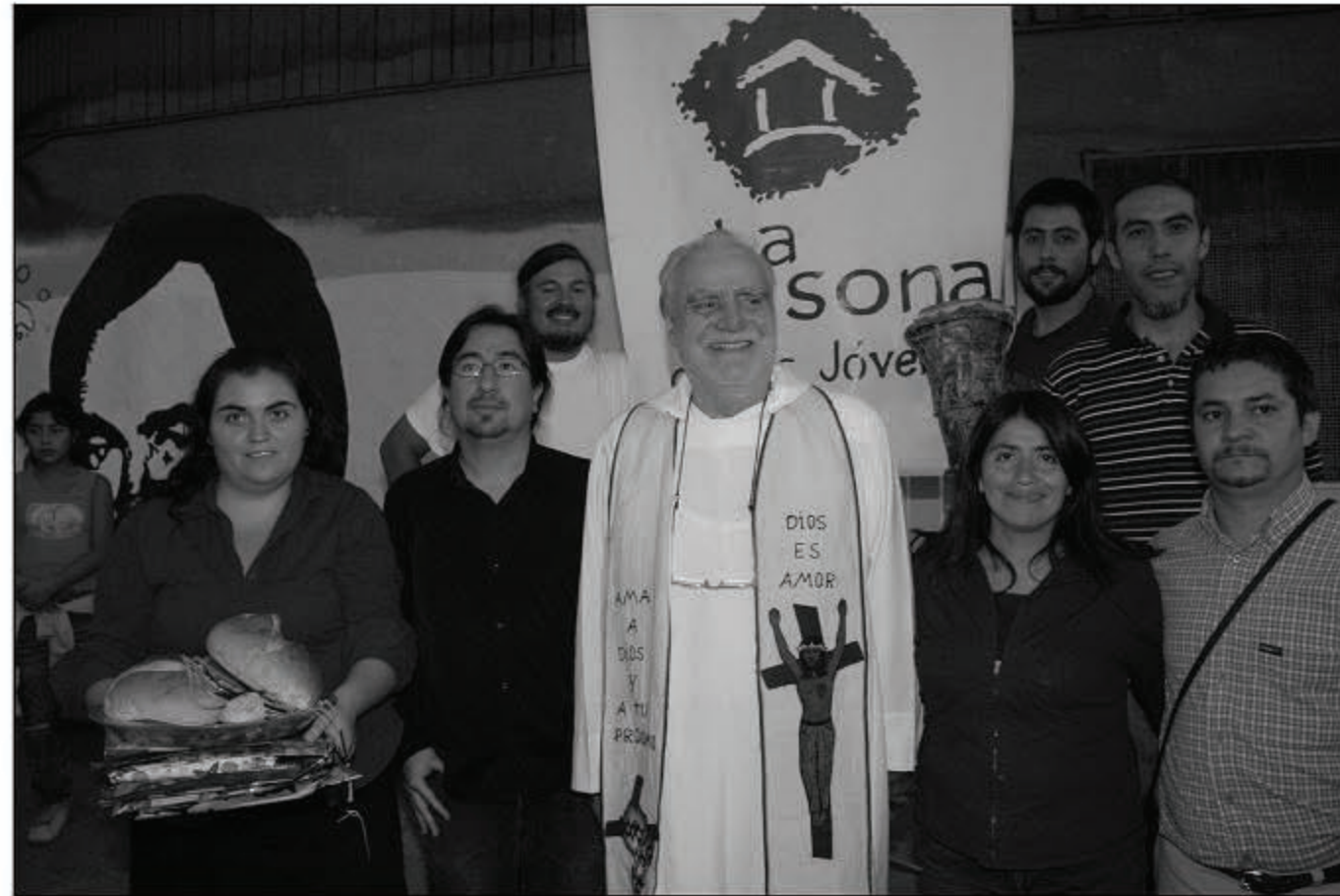
FOTOS: ANIVERSARIO LA CASONA DE LOS JOVENES

Fono: 2629457 – 2629447 Mail: ong.casona@gmail.com