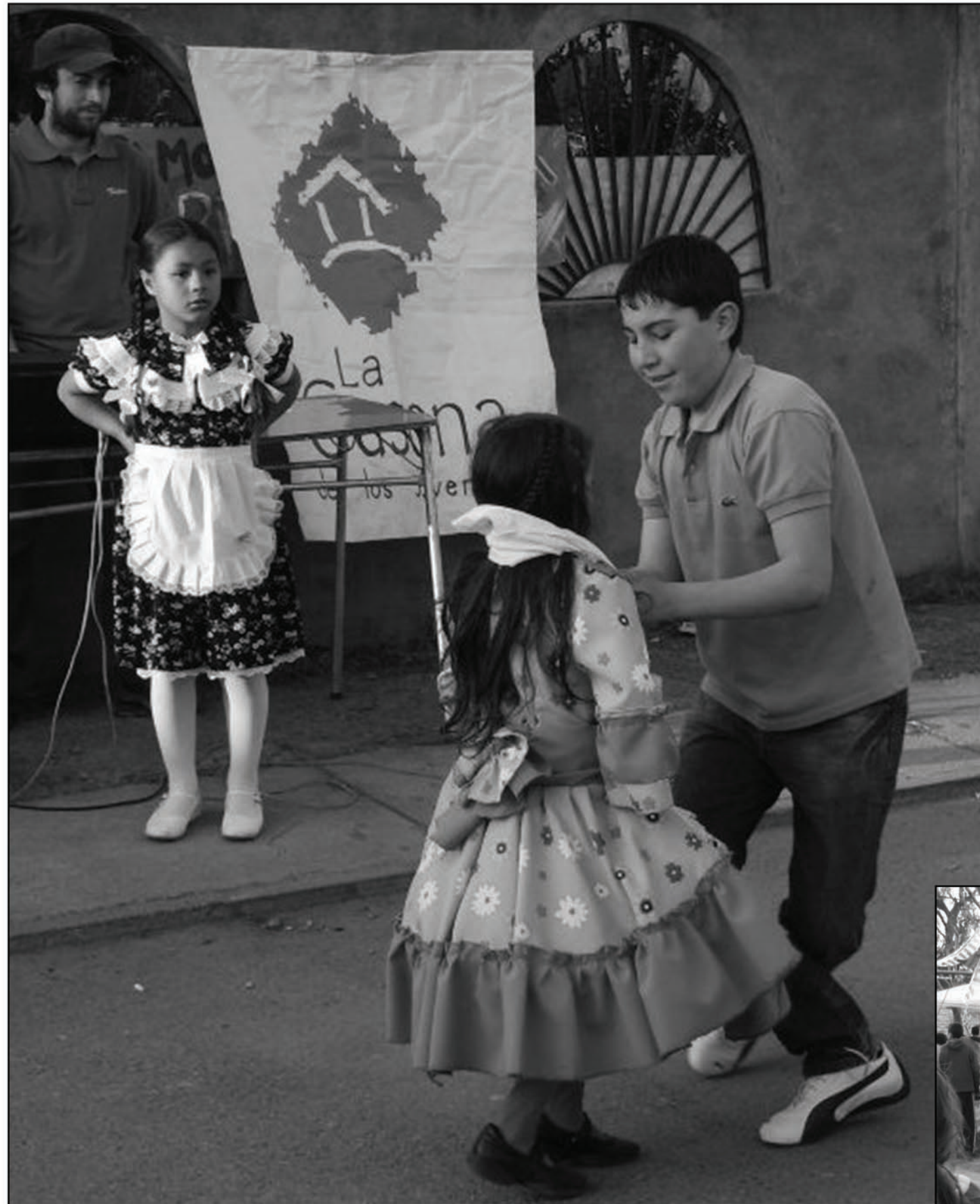
FOTOS: FIESTAS PATRIAS LA CASONA DE LOS JOVENES

AÑO I — N° 3 SEPT — OCTUBRE DE 2009 SUMARIO