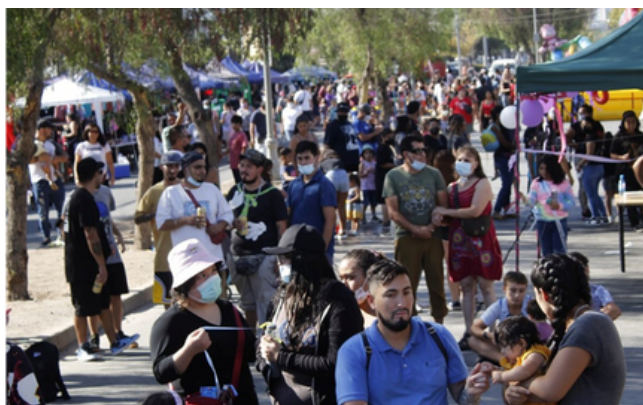
26 de febrero X Carnaval del Agua organizado por PPF La Florida en Villa O'Higgins, comuna de La Florida