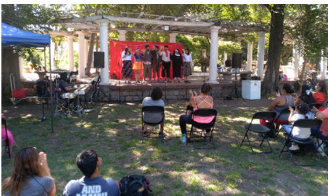
7 de enero. Expo Carnaval «Küpange» desarrollada por PDE San Bernardo en el Parque García de la Huerta, comuna de San Bernardo.