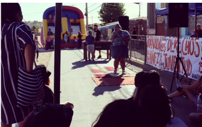
5 de marzo PDE Viña del Mar realizó la Jornada por los Derechos de la Niñez y Juventud.